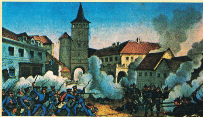
Noční boj na jičínském náměstí - vlevo Sasové, vpravo Prusové