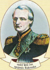
saský král Jan spojenec Rakouska