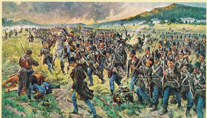
Rakouský pěší pluk č. 73 útočí proti Prusům u Ostružna

Okolo 18. hodiny nastal frontální útok pruského II. armádního sboru. Do těžkých bojů se dostaly všechny zbývající rakouské brigády: generálmajora Pireta u Železnice (pěší pluk č. 18 a 45 a prapor polních myslivců č. 29), generálmajora Poschachera v Podůlší a na Bradech (pěší pluk