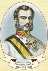
Franz Josef I. rakouský císař