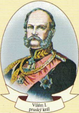
Wilhelm I. pruský král