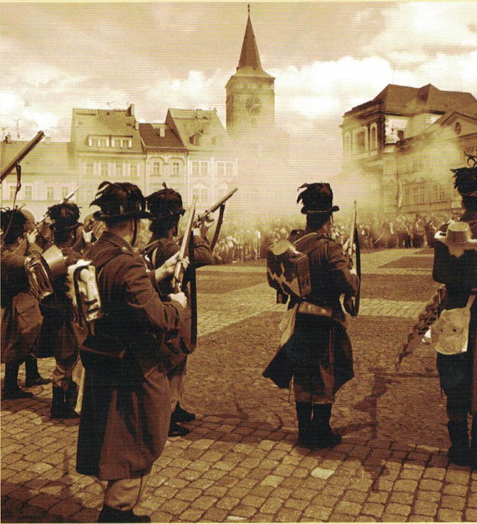
Přehlídka historických jednotek na Valdštejnově náměstí v Jičíně

V bitvě u Jičína ztratil rakouský I. a saský armádní sbor celkem 210 důstojníků, 5 280 mužů a 222 koní. Prusové měli ztráty 71 důstojníků, 1 485 mužů a 56 koní.