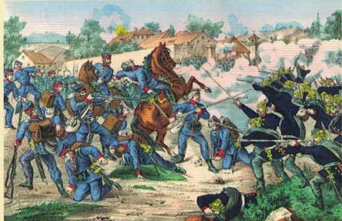
Zranění saského plukovníka von Boxberga u Dilců