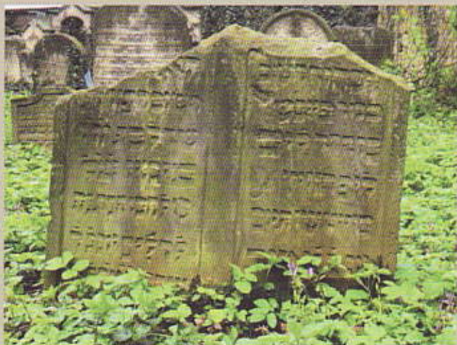
Nejstarší dochovaný náhrobek z roku 1734

Město Jičín bylo založeno v 90. letech 13. století. První židovské rodiny se v něm usadily ve 14. století, nevíme však, kde pohřbívaly své mrtvé. Židovský hřbitov v Jičíně – Sedličkách byl založen ve 2. polovině 17. století, kdy se po zavraždění Albrechta z Valdštejna roku 1634 a bouřích třicetileté války novým majitelem panství stal Rudolf z Tiefenbachu. Ten roku 1651 vydává Židům ochranný list, kterým jim dovoluje opět se usazovat v Jičíně, provozovat obchod a koupit si pozemek pro hřbitov, ze kterého odváděli roční úrok. Hřbitov se nachází 2 km severovýchodně od centra Jičína směrem k obci Valdice, na okraji bývalé obory. Na konci 19. století byl rozšířen a doplněn o pohřební domek („bejt tahara“, doslova „dům rituální očisty“), kde stával pohřební stůl, na kterém byl mrtvý připravován k pohřbu rituální očistou a obléknutím do bílého rubáše zvaného „tachrichim“. Pro potřebu očisty byla v rohu hřbitova vyhloubena studna. Na hřbitově je dále dochován přístavek na hřbitovní nářadí s dveřmi zdobenými Davidovou hvězdou. V ohradní zdi hřbitova je patrný kamenný portál zazděné tzv. kohanitské (kněžské) branky, která z důvodů rituální čistoty umožňovala přímý přístup příslušníkům kněžských rodin k hrobům svých příbuzných.