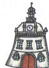
ilustrace: www.danyart.cz vydáno: 6/2019

Kulturní a informační centrum Nové Hrady nám. Republiky 46, 373 33 Nové Hrady infoc@novehrady.cz , kic@novehrady.cz tel.: 386 362 195, 603 882 340, 603 881 968 www.kicnovehrady.cz , @kicnovehrady