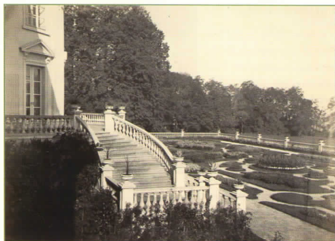
Zabradní parter, anonym, 60. léta 19. století, Ústav dějin umění AV ČR

Po roce 1958, kdy se v zámku usídlila střední zemědělská škola, došlo k některým nepříliš citlivým účelovým zásahům (výstavba tribuny, vytvoření výukových políček na parteru a plochy pro norování). Ty však zmizely po zrušení školy a celkové rehabilitaci parku v letech 1999–2000. Její součástí bylo zejména ošetření vzrostlých stromů, vyčištění od náletových dřevin, obnovení cestní sítě a průhledů do krajiny. Byl též odstraněn plot, který odděloval parterovou část od krajinářského parku.