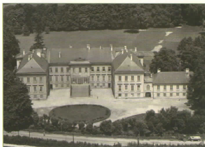
Zámek na letecké pohlednici, 1967

Zámek hraběcí rodina obývala až do roku 1945, kdy na základě Benešových dekretů připadl státu. V letech 1951–1957 se celý areál stal domovem pro dětské uprchlíky z občanské války v Řecku. Od roku 1958 zde čtyřicet let sídlila Střední zemědělská technická škola. Nyní je objekt v majetku Mikrobiologického ústavu akademie věd ČR, který ho spolu s Ústavem komplexních systémů Fakulty rybářství a ochrany vod Jihočeské univerzity využívá jako výzkumné i konferenční centrum. Zámek a jeho okolí je též oblíbeným místem konání svatebních obřadů.