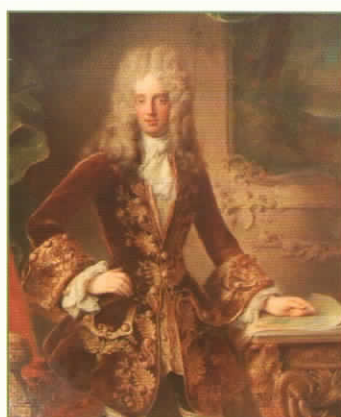
Karel Kajetán Buquoy (1676–1750) s rukou na plánu panské zahrady a borní bažantnice