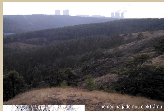
pohled na jadernou elektrárnu