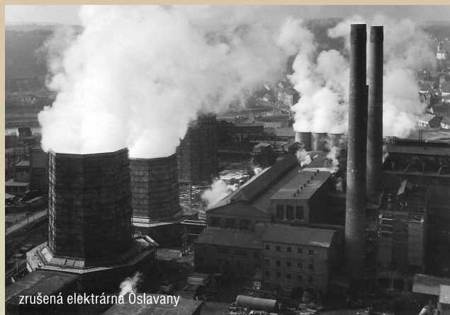
zrušená elektrárna Oslavany

Tématická okružná stezka Energetická 5175, 5173,403 a bílé pásové značení Od historie do současnosti energetiky přes dvě přehradu na řece Jihlavě