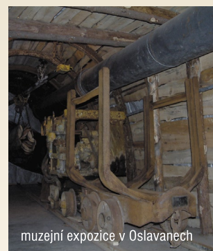
muzejní expozice v Oslavanech