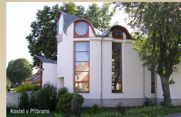
Kostel v Příbrami