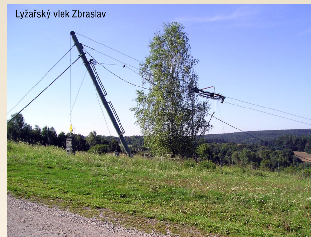
Lyžařský vlek Zbraslav