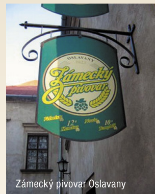
Zámecký pivovar Oslavany

Pivovar byl vybudován v západním křídle oslavanského zámku na místě původního panského pivovaru, ve kterém se vařilo pivo od roku 1623 do roku 1863. V roce 2003 zde vybudovala firma G&C Pacific pivovar nový. Roční výstav je kolem 1 tisíce hektolitrů. Vaří se zde nepasterovaná piva českého typu podle originálních receptur. Ochutnat můžete kvasnicovou světlou 10° Novic, nebo výčepní 10° Templář, světlou 12° Komtur, „červenou“ kvasnicovou Františkovu 13° a dvakrát do roka je na čepu pivní speciál Velmistr, který má 15°. U pivovaru je stylová zámecká restaurace. Návštěvu restaurace můžete spojit s prohlídkou renesančního zámku ze 16. stol. s ojedinělým arkádovým nádvořím. Zámek vznikl přestavbou l. ženského cisterciáckého kláštera na Moravě „Vallis s. Mariae“ (údolí Mariino) založeného r. 1225. V jižním křídle zámku jsou expozice muzea Hornictví a energetiky a Hasičského muzea. Každý druhý víkend v září se konají na zámku Oslavanské historické slavnosti.