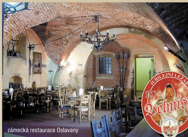
zámecká restaurace Oslavany

Okruhová tématická cyklostezka Pivovarská 5170, 5199, 403, 5106, 5107, 5175, zelené pásové značení Z Oslavanského zámeckého pivovaru k Dalešickému pivovaru filmových „Postřižín“