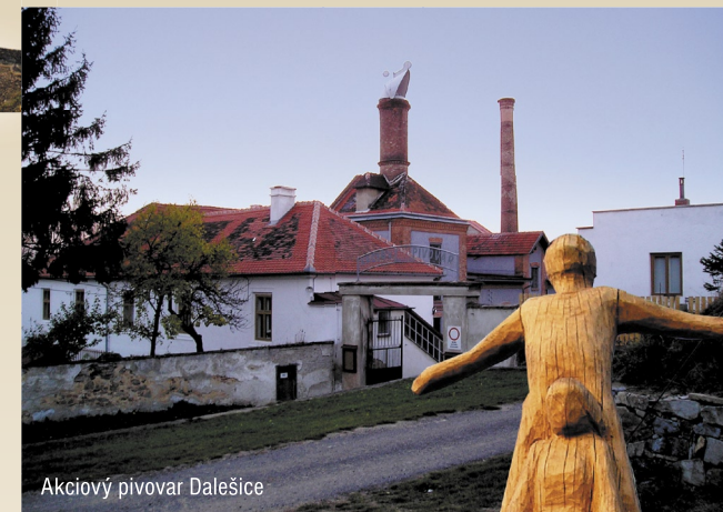
Akciový pivovar Dalešice