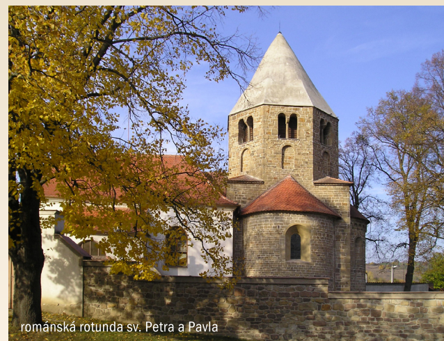
románská rotunda sv. Petra a Pavla