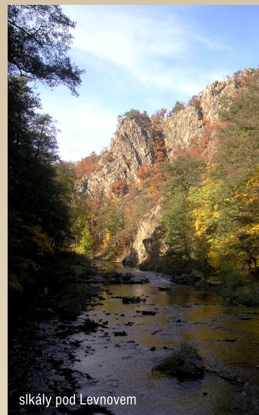
skály pod Levnovem