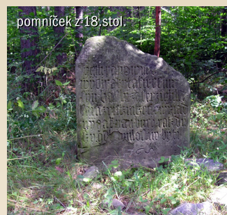
pomník z 18. stol.

Oslavany – Ketkovice – Senorady – Biskoupky – Templštn – Hrubšice – Řeznovice – Ivančice, Alexovice – Ivančice, Letkovice – Oslavany délka 39 km