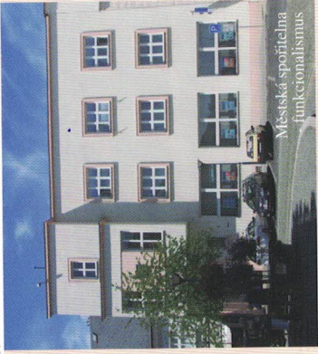
Městská sportovní hala funkcionálistismus