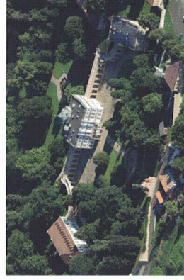
Severní část zámekého areálu