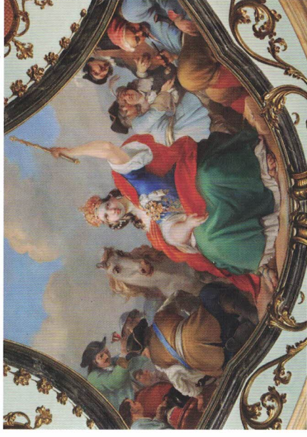
Václav Vavřínek Reiner: Evropa. Nástropní malba v reprezentačním sále