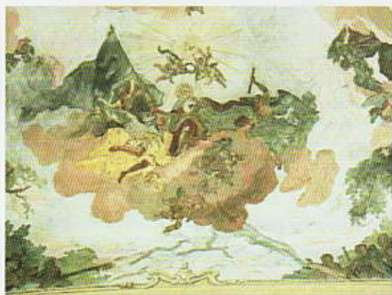
Nástropní freska Apoteóza světce

Nejblíže k presbytáři je zobrazen výjev Zavraždění sv. Václava , dále Apoteóza světce a zjevení sv. Václava sestře Přibyslavě . Fresky v lodi byly obnoveny Josefem Scheiwelem.