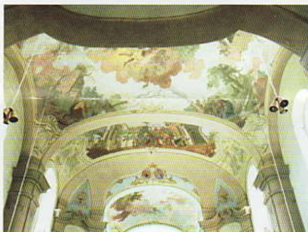
Nástropní fresky tří polí kostelní lodi

Lod' kostela má tři pole, prostřední je největší. Na klenbách jsou nástropní fresky rovněž od J. V. Spitzera z r. 1756 s výjevem ze života sv. Václava.