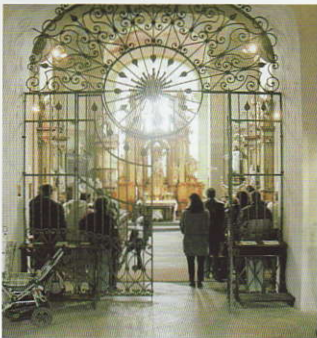
Ozdobná mříž z r. 2002