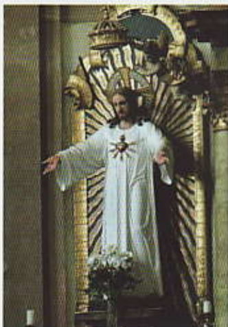
Mníšecký „Sacré Coeur“

Na pravé straně kostelní lodi je na zdi umístěna socha Krista v životní velikosti s hořícím srdcem.