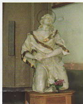
Kající se Maří Magdalena

Mezi bočními oltáři na pravé straně lodi kostela je umístěna socha kající se Maří Magdalény.