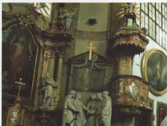
Sousaší rodiny Unwertů a oltář Jana Křtitele