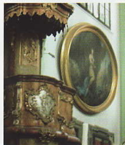
Obraz sv. Maří Magdaleny a kazatelna