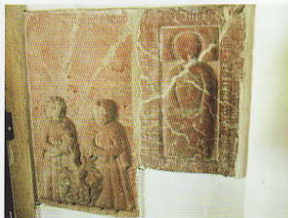
Náhrobní kameny z 16. stol. z původního kostela

Z původního kostela pochází pouze cínová křtitelnice a dva náhrobní kameny z 16. století.