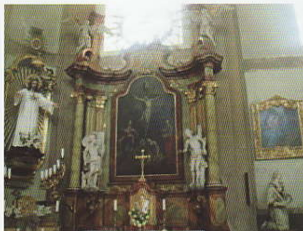
Barokní boční oltář s výjevem ukřižování z Golgoty

Druhý boční oltář, rokokový, s obrazem Modlící se Jan Nepomucký pochází asi z druhé poloviny 18. st.