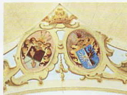
Znaky rodů Unwerthů a Čejků z Olbramovic

Na vítězném oblouku jsou znaky rodin Unwerthů a Čejků z Olbramovic.