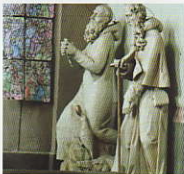
Poustevníci Antonín Egypťský a Pavel Thébský

Po stranách před oltářem stojí dva páry soch poustevníků původně z kostelíka na Skalce se svými charakteristickými znaky - svatí Prokop a Ivan vlevo, Antonín Egypťský a Pavel Thébský vpravo.