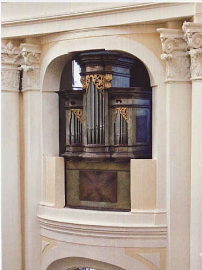
Součástí areálu Horního zámku v Panenských Břežanech je kaple svatě Anny. Jejím autorem byl slavný český architekt barokní gotiky Jan Blažej Santini – Aichel.