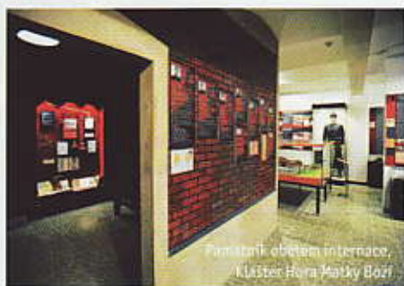
Památník obětem internace, Kláster Hora Matky Boží

Kláster na Hoře Matky Boží, 4077 křížovátka Hedeč > rozhledna Val > svatá Trojice (4,5 km); neznačená odbočka k Severomoravské chatě (640 metrů); zpět 4077 Králíky > svatá Trojice, Rudolfův pramen (600 metrů); 4071 svatá Trojice > Písařov (8,7 km);