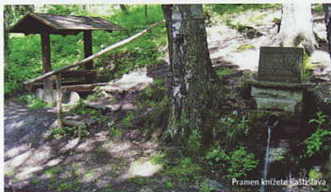
Pramen knížete Rostislava

Přírodní park Suchý vrch – Buková hora • pramen knížete Rostislava • naučná stezka Betonová hranice • Muzeum československého opevnění – dělostřelecká tvrz Bouda • rozhledna Suchý vrch • Kramářova chata • obora s jeleny • Informační centrum na Červenovodském sedle • výhledy z Bukové hory • lanová dráha na Bukovou horu