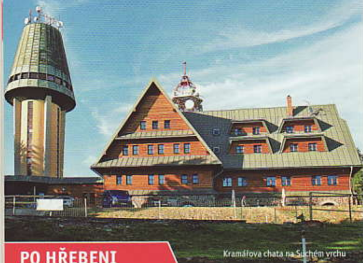
Kramářova chata na Suchém vrchu