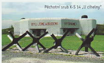
Pěchotní srub K-S 14 „U chelny“

Památková zóna města Králíky, Městské muzeum Králíky • Naučná stezka Vojenské historie Králíky, Vojenské muzeum Králíky • Muzeum československého opevnění, pěchotní srub K-S 14 „U chelny“ • Ptačí oblast • Národní přírodní rezervace Králický Sněžník • vyhlídky na pohoří Králického Sněžníku a Jeseníků • pásmo železobetonových bunkrů z II. světové války • Kladské sedlo • pivovar Hanušovice • dělostřelecká tvrz Hůrka