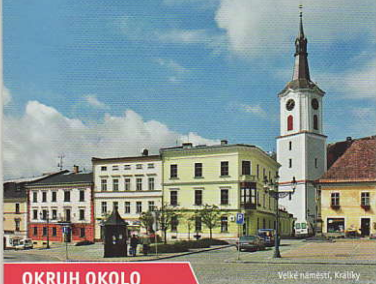
Velké náměstí, Králíky