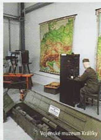
Vojenské muzeum Králupy