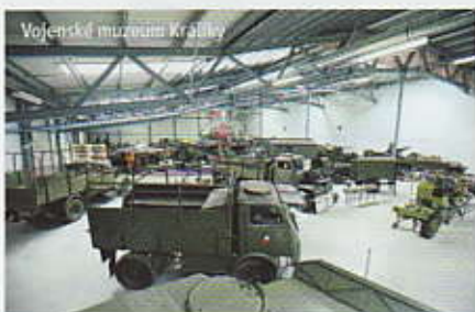
Vojenské muzeum Králíky

4361 Králíky > Horní Lipka – odbočka ke kostelu (5,3 km); 4068 Horní Lipka > Pod Klepáčem (3,8 km); 6269 Pod Klepáčem > CZ/PL hranice (2,1 km); červená – hranice CZ/PL > Pod Kamiennym Garbem (3,5 km); modrá Pod Kamiennym Garbem > Goworów (5,3 km); šedá Goworów > Miedzylesie > pod Bochniakem (8,8 km); zelená pod Bochniakem > Kamińczyk – Petrovičky (3,6 km); 4077 Petrovičky > Mladkov > Lichkovský dvůr (7 km), 4361 Lichkovský dvůr > Králíky (7 km)