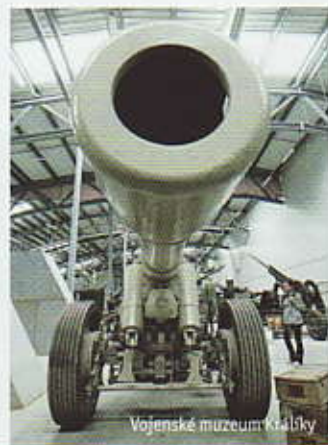
Vojenské muzeum Králíky