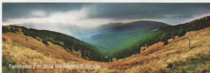
Panorama z východu Králického Sněžníku

Národní přírodní rezervace Králický Sněžník • Ptáčí oblast • Jeskyně Tvarožné díry • chata Slaměnka • vyhlídky na pohorí Králického Sněžníku a Jeseníků • pásmo železobetonových bunkrů z II. světové války • vodopád Malé Moravy