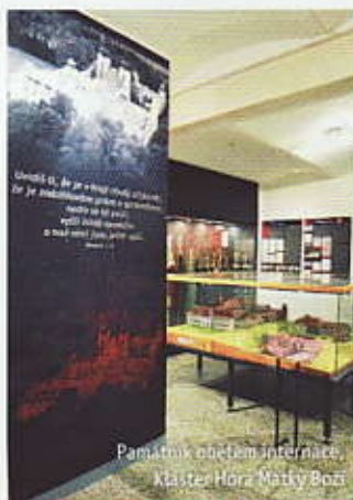
Památník obětem internace, Klášter Hora Matky Boží

Svatých schodů), Památník obětem internace • Pěchotní srub K-S 8 U nádraží • kostel svatě Anny, Horní Lipka • kostel Nejsvětější Trojice, Heřmanice • Muzeum československého opevnění, pěchotní srub K-S 14 „U cihelny“ • Vojenské muzeum Králupy