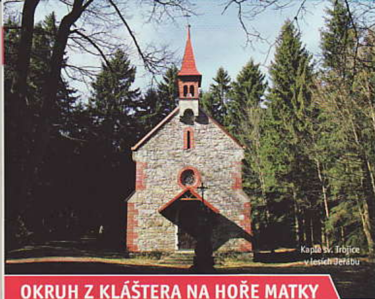
Kaple sv. Trojice v lesích Jeřábu