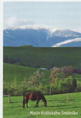
Masy Králického Sněžníku