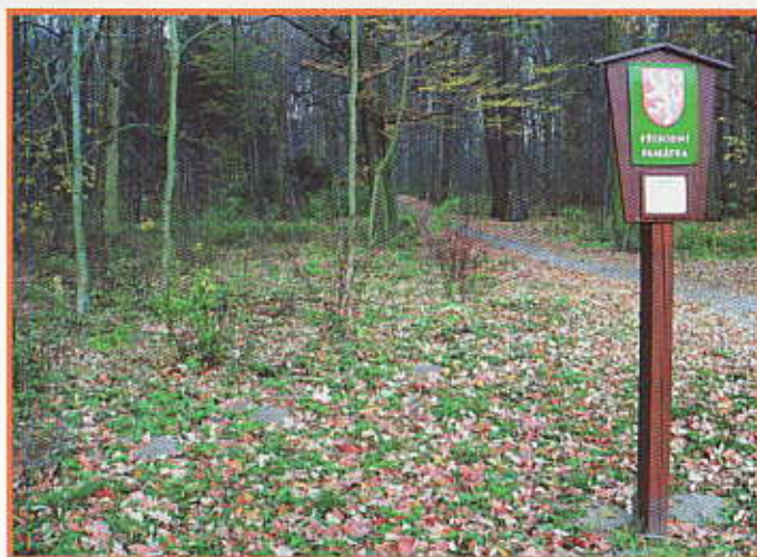
Bažantnice - přírodní památka

Letohradská Bažantnice byla v roce 1954 vyhlášena jako chráněné území - státní přírodní rezervace s rozlohou 4,4 ha. Letohradská, dříve kyšperská, Bažantnice sice nebyla založena, jak se uvádělo jako druhá v Čechách, ale v současné době je skutečně v Čechách nejstarší zachovalou lokalitou používající zvláštní ochrany podle zákona 114/92 Sb. O ochraně přírody a krajiny, §36 - přírodní památka. Jde původně o dubohabřinu s významným podílem starých lip, skladba dřevin se však mění. Dnes zde najdeme statné jedince lípy srdčité, v menší míře zde roste jasan, dub letní, jedle, borovice a smrk. Keřové patro je tvořeno hlavně střemchou a brslenem. Z ochranných významných rostlin se zde vyskytuje česnek medvědí, lýkovec jedovatý, zápalice a prvosenka vyšší. Při posledním odborném výzkumu byl zjištěn výskyt 37 ptačích druhů (některých jen občasné). Z nich možno uvést brhlík lesní, červenku obecnou, drozda zpěvného, jirčičku obecnou, kavku obecnou, kosa černého,