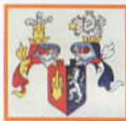
Erb rodu Vitanovských