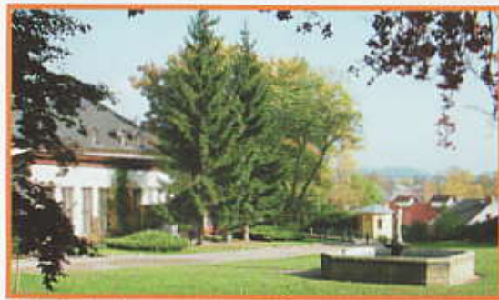
Pohled na budovu oranžerie v parku

V pravém horním rohu parkové zdi stojí otevřený empírový altán jako odpočívadlo, v levém horním rohu pak umělá jeskyně (grotta) s vyhlídkou. V dolní části parku byla vybudována oranžerie, kde se pěstovaly tropické rostliny, kaktusy a bonsaje. Byla zde pěstována nejstarší bonsaj v Evropě. Kašna s nymfou z roku 1837 byla do parku přemístěna z náměstí, kde stála původně.