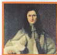
Hrabě Hynek Jetřich Vitanovský z Vlčkovic