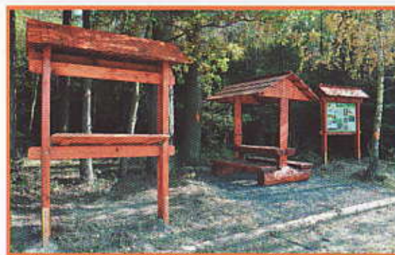
Naučná stezka - odpočívadlo s panoramatickou mapou

Bažantnicí vede naučná stezka, která byla vybudována v roce 2010 v rámci Programu 2000. Investorem byly Lesy České republiky, s. p., Lesní správa Lanškroun.