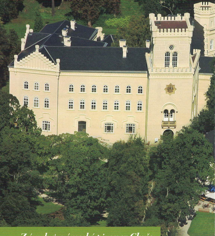
Zámek & zámecký pivovar Chyše

Z ámek Chyše leží 35 km východně od Karlových Varů. Historie tohoto sídla počíná již rokem 1169, tehdy zde však stávala tvrz, jež byla ve 13. století přestavěna v gotický hrad. Podobu renesančního zámku získaly Chyše roku 1578, další, tentokrát barokní přestavba byla dokončena roku 1708. Barokní epochu dodnes připomíná malba na stropě jednoho ze salonů od nejvýznamnějšího českého barokního mistra Petra Brandla. Současnou podobu získal zámek při novogotické přestavbě v letech 1856 – 1858. Zámek je v majetku rodiny Lažanských již od roku 1766. V roce 1917 působil v Chyších coby domácí učitel světově proslulý spisovatel Karel Čapek.