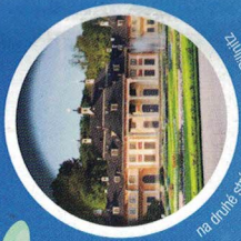
Na druhé straně zámeček a vlnitá říčka