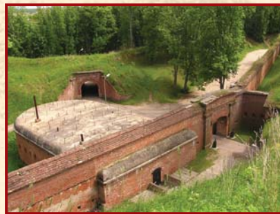
Twierdza Boyen • Boyen Fortress • Festung Boyen