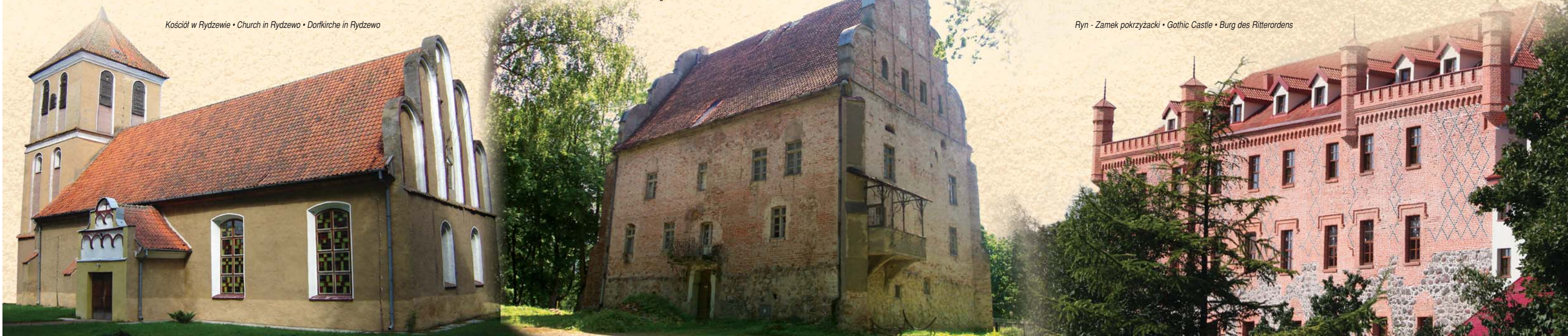
Kościół w Rydzewie • Church in Rydzewo • Dorfkirche in Rydzewo