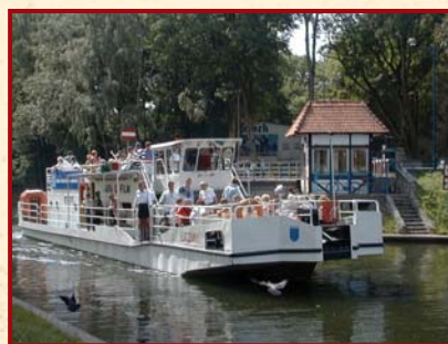
Most obrotowy na Kanale Łuczańskim • Swing Bridge • Drehbrücke

Doba: Późnogotycki, murowany kościół z XVI w. (1574), obecnie mieści się tu parafia rzymsko-katolicka. Cmentarz z kaplicą rodową z 1844 roku. Kuźnia z połowy XIX w.