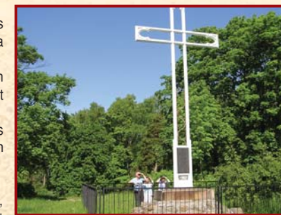
Krzyż Brunona • Bruno's Cross • Brunokreuz

Doba – spätgotische, gemauerte Dorfkirche aus dem 16. Jh., Friedhofskapelle der Familie Trautenberg aus dem Jahr 1844, Landgut und Schmiede aus dem 19. Jh.