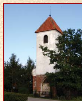
Doba - Kościół z XVI w. • Church of XVI-th century • Dorfkirche aus dem 16.Jh

Wydminy: evangelical Church, brick, half of the XVI-th century. At present Rome - Catholic parish.