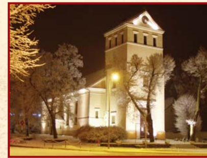
Kościół ewangelicki z 1827 r. • Protestant church from 1827 • Evangelische Kirche vom Jahre 1827

Doba: Late gothic, brick church of XVI-th century (1574). Cemetery with ancestral chapel of 1844. Smithy of the first half of XIX-th century.