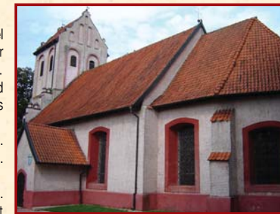
Mitki - Najstarszy kościół na Mazurach • The oldest church in Masuria • Die älteste Dorf Masurens